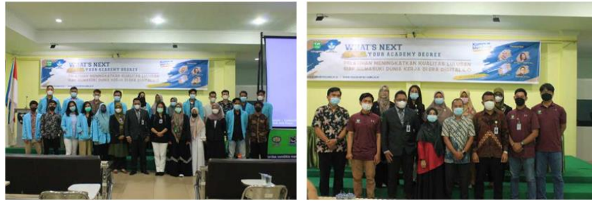
Gambar 2. Dokumentasi kegiatan

terhadap pelaksanaan kegiatan juga memberikan masukan penting bagi institusi dalam meningkatkan kolaborasi antara dosen, mahasiswa, dan dunia industri, serta menyesuaikan kurikulum agar lebih relevan dengan kebutuhan pasar kerja.