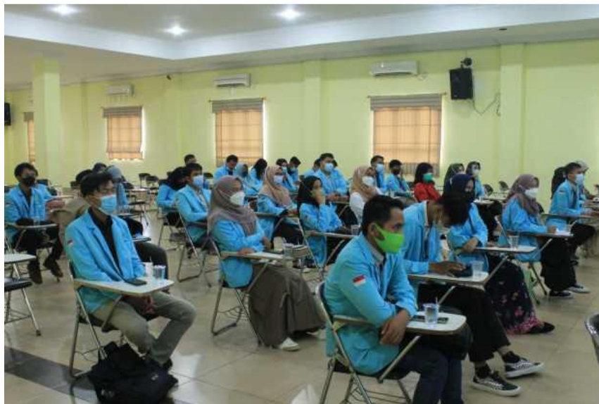
Gambar 3. Penyampaian materi