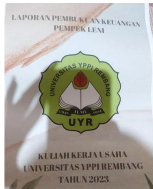
Gambar 5. Pembukuan keuangan

Pembuatan keuangan dapat membantu mengontrol biaya pemasukan dan juga pengeluaran UMKM.