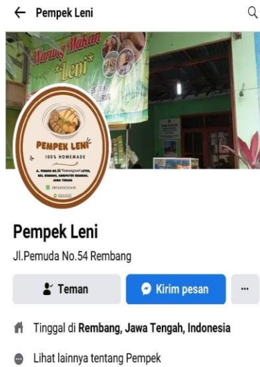
Gambar 3. Akun Facebook

Pembuatan Akun Facebook dapat memudahkan untuk mempromosikan produknya secara online melalui media sosial