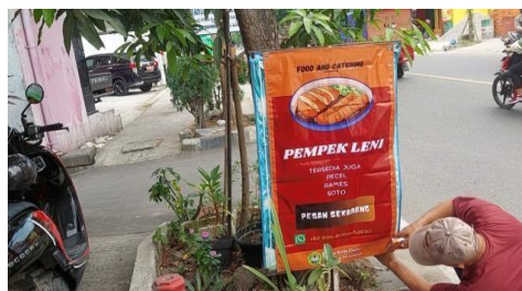
Gambar.1 Banner Produk

Terpasangnya Banner akan membuat produk dikenal oleh masyarakat luas.