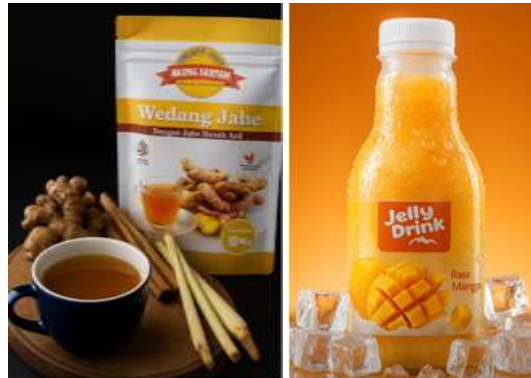
Gambar 3. Produk UMKM di Kel. Manis Jaya, Kec. Jatiuwung, Kota Tangerang

nyatanya terlihat dari bantuan pembuatan banner, pembuatan akun media sosial untuk promosi, serta pencantuman alamat usaha di Google Maps, yang semuanya bertujuan untuk memperluas jangkauan pemasaran dan meningkatkan daya saing UMKM di era digital. Prinsip ramah lingkungan juga diterapkan secara konkret dengan mendorong penggunaan kemasan yang lebih ramah lingkungan, efisiensi energi, serta pengelolaan limbah produksi yang lebih baik. Seminar UMKM yang menghadirkan dosen sebagai pemateri turut memperkaya pengetahuan pelaku usaha tentang transformasi digital dan praktik ramah lingkungan.