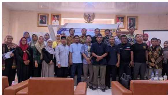
Gambar 2. Kegiatan Seminar Pemberdayaan Ekonomi Lokal melalui UMKM Ramah Lingkungan di Kel. Manis Jaya, Kec. Jatiuwung, Kota Tangerang

Program KKN ini dimulai dengan pembukaan pada 16 Juli 2025 di Kecamatan Jatiuwung dan dilanjutkan secara resmi di Kelurahan Manis Jaya pada 26 Juli 2025, di mana mahasiswa mempresentasikan program kerja yang akan dilaksanakan. Langkah awal yang krusial adalah survei UMKM di RW 05 yang melibatkan tujuh pelaku usaha, untuk memetakan potensi dan kebutuhan pengembangan usaha mereka.