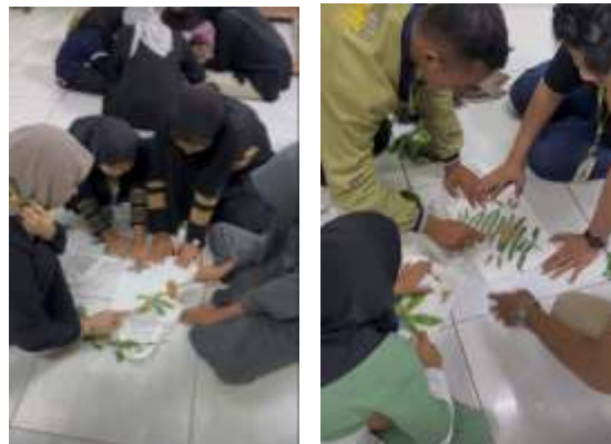
Gambar 4. Kegiatan Ecoprint untuk mengasah kreatifitas, dan pemanfaatan sumber daya alam yang berkelanjutan

Selain itu, terjadi Peningkatan Pengetahuan dan Kesadaran Lingkungan di kalangan masyarakat. Program literasi pengelompokan sampah, yang diajarkan melalui materi dan permainan edukatif, berhasil menanamkan pemahaman pentingnya memilah sampah sejak dini kepada anak-anak. Kegiatan ecoprint juga tidak hanya mengasah kreativitas seni, tetapi juga mendidik tentang pemanfaatan sumber daya alam secara berkelanjutan. Edukasi ini mendorong perubahan perilaku dari sekadar membuang sampah pada tempatnya menjadi memilah sampah sesuai kategori organik, anorganik, dan B3.