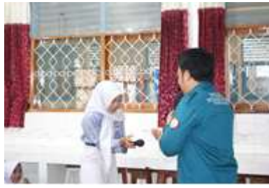
Gambar 4. Praktik Public speaking

Praktik yang dilaksanakan tidak hanya membantu peserta dalam mengatasi rasa gugup dan membangun kepercayaan diri, tetapi juga mampu mengasah keterampilan berbicara seperti pengaturan intonasi suara, ekspresi wajah, serta kemampuan mengelola audiens dan penguasaan panggung saat melakukan public speaking . Melalui praktik langsung tersebut, siswa memperoleh pengalaman nyata dalam menerapkan teknik komunikasi yang telah dipelajari selama pelatihan.