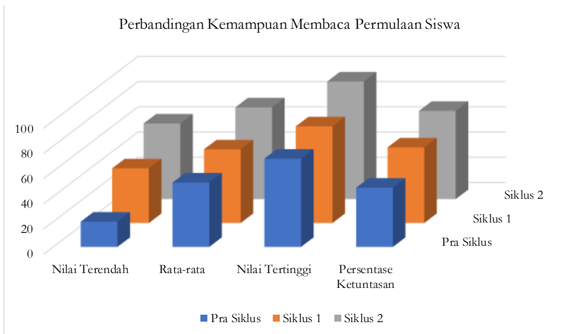
Gambar 1 Pena

Hasil ini menunjukkan bahwa media kartu huruf bergambar telah berhasil meningkatkan kemampuan membaca permulaan siswa kelas 1 MI NW Temempang. Berlangsungnya penelitian dalam dua siklus menunjukkan proses peningkatan yang signifikan pada setiap siklusnya, terhadap kemampuan membaca permulaan awal pra siklus.