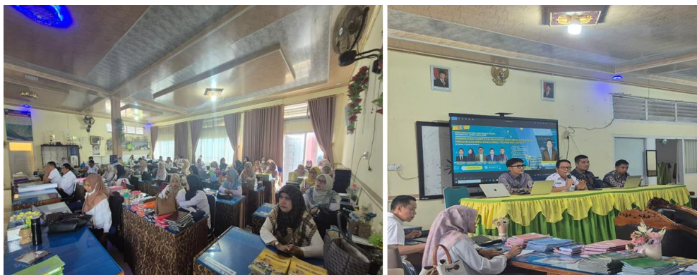
Gambar 1. Kegiatan pelatihan media edtech di sman 2 sungai penuh

Program pengabdian kepada masyarakat ini dirancang untuk mengatasi tantangan rendahnya literasi digital dan kompetensi pedagogik guru di SMAN 2 Sungai Penuh.