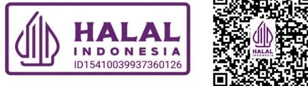
Gambar 3. Hasil Legalisasi Sertifikat Halal pada UMKM Telur Asin Masak Neiz

Kegiatan pengabdian kepada masyarakat yang berfokus pada pendampingan sertifikasi halal dan analisis laba pada UMKM telah memberikan dampak positif terhadap peningkatan kapasitas pelaku usaha. Kegiatan ini berhasil meningkatkan pemahaman dan kesadaran UMKM mengenai pentingnya sertifikasi halal yang berperan pada legalitas produk yang prosesnya mampu meningkatkan kepercayaan konsumen. Selain itu, melalui pendampingan yang dilakukan secara intensif, sebagian pelaku UMKM telah mampu mengikuti proses pengajuan sertifikasi halal.