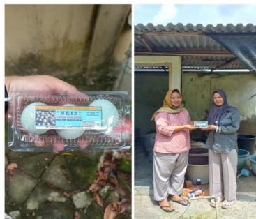
Gambar 2. Identifikasi Masalah UMKM Telur Asin Masak Neiz

Kegiatan pengabdian dilaksanakan selama dua bulan yaitu februari 2026 hingga maret 2026. Pelaksanaan kegiatan diawali mengidentifikasi masalah yang dihadapi oleh UMKM Telur Asin Masak Neiz di Kota Jambi melalui observasi langsung ke lokasi usaha serta wawancara dengan pemilik usaha dan melakukan pencatatan terhadap usaha yang telah berjalan.