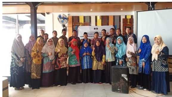
Gambar 3. Peserta Kegiatan Pendampingan