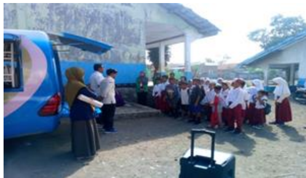
Gambar 2. Pelaksanaan kegiatan

Pengarahan ini juga disertai simulasi singkat atau contoh praktik langsung, di mana guru memperagakan cara mengambil buku dari rak dengan hati-hati, membacanya di tempat yang disediakan, dan kemudian mengembalikannya ke posisi semula. Hal ini membantu siswa yang masih dalam tahap perkembangan kognitif dan sosial untuk memahami aturan secara konkret [11]. Dalam mobil Dinas Perpustakaan Daerah Kabupaten Dompu telah menyiapkan beberapa buku diantaranya adalah Buku cerita, bergambar, fiksi anak dan berhitung. Yang dapat meningkatkan literasi anak, semuanya telah sediakan di mobil dinas perpustakaan berjalan daerah Kab. Dompu, semuanya itu di desain agar dapat menarik minat peserta didik dalam membaca.