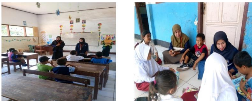
Gambar 3. Pelaksanaan kegiatan

Selanjutnya, Sebagai bentuk dukungan terhadap fasilitas literasi, mahasiswa KKN dan bersama guru melakukan pengembangan pojok baca kelas di setiap sekolah mitra. Pojok baca ditata dengan menarik menggunakan media sederhana yang ada di sekolah dan dibuat oleh MAhasiswa KKN, selain itu mereka juga menyiapkan buku cerita anak dan bacaan bergambar sesuai dengan usia dan tingkat perkembangan siswa. Pojok baca ini menjadi pusat kegiatan membaca yang ramah anak dan mudah diakses kapan saja oleh siswa [13].