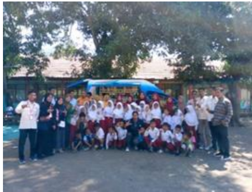
Gambar 4. Pelaksanaan kegiatan

Secara keseluruhan, pelaksanaan kegiatan PKM ini menunjukkan dampak positif terhadap budaya literasi di sekolah mitra. Guru-guru tidak hanya mendapatkan wawasan baru, tetapi juga semangat dan kepercayaan diri untuk terus melanjutkan dan mengembangkan kegiatan literasi secara mandiri di kelas masing-masing. Minat baca siswa pun mulai tumbuh melalui kegiatan yang menyenangkan, sederhana, namun konsisten dan bermakna.