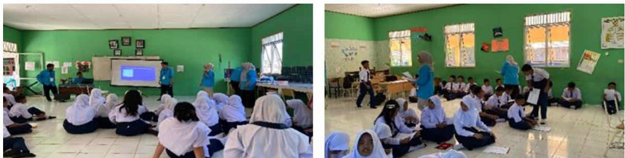
Gambar 4. Tim KKN mensosialisasikan pengenalan perangkat keras komputer dan membagikan soal pre test dan post test

Gambar 3. Tim KKN Unmuh Babel membuat soal post test untuk mengukur pengetahuan siswa SMPN 04 Parittiga setelah diberikan Sosialisasi Pengenalan Perangkat Keras Komputer.