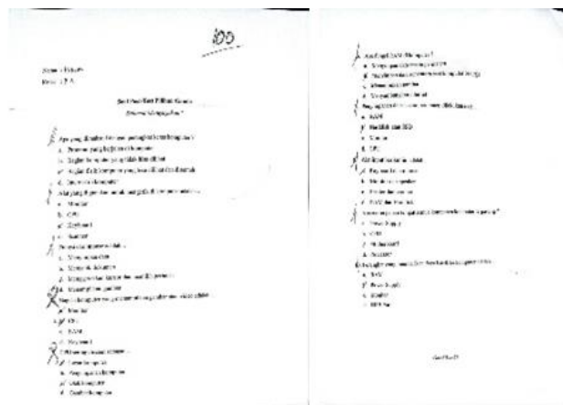
Gambar 3. Soal post-test

Gambar 2. Tim KKN Unmuh Babel membuat soal pre-test untuk mengukur pengetahuan siswa SMPN 04 Parittiga sebelum Sosialisasi Pengenalan Perangkat Keras Komputer dimulai.