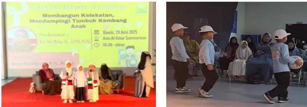
Gambar 2. Pelaksanaan Kegiatan

Program pengabdian dengan tema “Membangun Kelekatan, Mendampingi Tumbuh Kembang Anak” dilaksanakan pada hari Sabtu, 19 Juni 2025 pada pukul 08.00 WITA hingga pukul 12.00 WITA yang dihadiri oleh orang tua siswa serta para guru di jenjang pendidikan usia dini. Program dilaksanakan dengan memberikan materi psikologis bertemakan kelekatan dan tumbuh kembang anak yang mencakup kajian perkembangan anak usia dini, proses terbentuknya kelekatan, dampak kelekatan orang tua-anak dalam pendidikan, serta gaya pengasuhan yang membentuk kelekatan aman dan nyaman bagi anak.