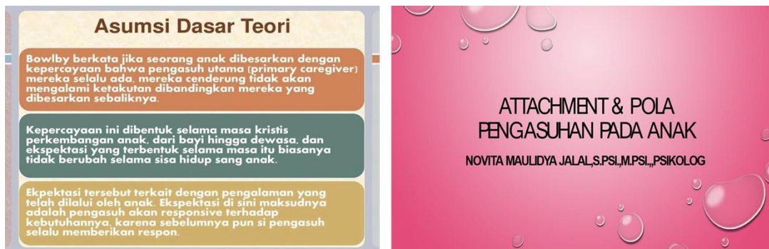
Gambar 3. Pemberian materi melalui tayangan slide show ppt

Program menghasilkan peningkatan signifikan pada pemahaman orang tua mengenai konsep kelekatan aman dan kebutuhan perkembangan anak usia dini. Berdasarkan evaluasi awal dan akhir, sebagian besar peserta menunjukkan peningkatan skor pengetahuan tentang kelekatan, ciri hubungan pengasuhan responsif, serta kemampuan membaca isyarat emosional anak. Hasil ini selaras dengan penelitian yang menegaskan bahwa metode edukatif berbasis ceramah visual efektif dalam meningkatkan literasi pengasuhan pada komunitas yang akses informasinya terbatas [13], [14].