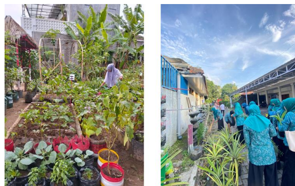
Gambar 2. Dokumentasi Kebun Gizi

Ketahanan Pangan merupakan salah satu program penyuluhan karena didasari oleh pentingnya pemanfaatan lahan digunakan sebagai sumber pangan lokal yang bergizi dan sehat. Kegiatan penyuluhan ini berlangsung ±2 jam.