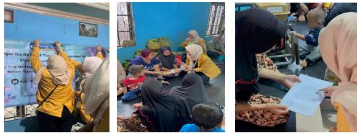
Gambar 2. Tahap persiapan, pembagian kuesioner dan pembagian sembako

Tahap perencanaan, pada tahapan ini di mulai dari menentukan tempat dan tema yang akan di bawakan, setelah itu di lanjutkan dengan survey ke tempat tujuan untuk melihat permasalahan yang terjadi dan di dapatkan bahwa kurangnya pengetahuan tentang stunting, pada tahapan ketiga yaitu prose persiapan pkm yaitu dengan mengantar surat izin ke ketua rt dan mengajak kerja sama dengan mitra yang terlibat, setelah itu dilanjutkan dengan penyusunan acara penyuluhan (SAP), kemudian pembuatan dimsum ikan patin, lalu pada tahap pelaksanaan dilakukannya kegiatan pkm dengan memberikan materi oleh tim pemateri dan dosen melalui powerpoint, serta pembagian kuesioner dimana nantinya akan di isi oleh para peserta, adanya kuesioner ini untuk mengetahui tingkat pengetahuan masyarakat tentang stunting, dan yang terakhir adalah tahap evaluasi hasil kegiatan yang di laksanakan, media yang di gunakan dalam dalam kegiatan ini adalah Lcd, Mic, Speaker, Spanduk dan laptop.