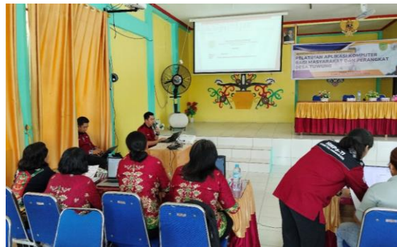
Gambar 3. Penyampaian materi dari dosen stmik palangkaraya

Penyampaian materi dilakukan oleh Dosen dalam tim pengabdian. Gambar 3 menunjukkan penyampaian materi dari salah satu tim pengabdian.