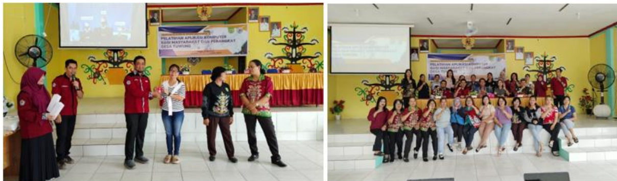
Gambar 4. Pemberian hadiah kepada pemenang dan foto bersama kepala desa tuwung, tim pkm, dan peserta

Hasil pre-test dan post-test didapat 3 peserta sebagai pemenang. Pemberian hadiah kepada pemenang. Sebelum acara berakhir, dilakukan sesi foto bersama seperti pada gambar 4.