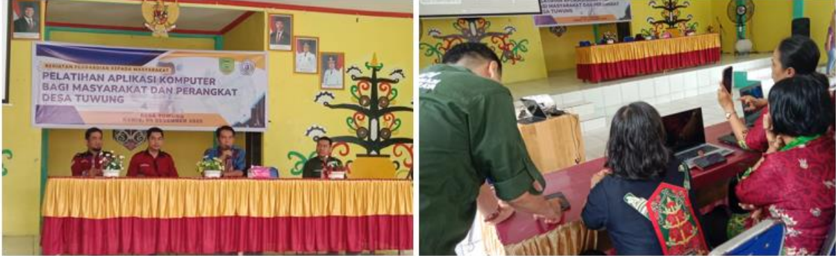
Gambar 2. Acara pembukaan dan penyampaian instruksi cara memberikan jawaban oleh peserta

Kegiatan Pengabdian Kepada Masyarakat (PKM) ini diawali dengan acara pembukaan oleh tim PKM. Pembukaan kegiatan dengan memperkenalkan tim kepada peserta pengabdian, menyampaikan tujuan, manfaat, serta tahapan selama kegiatan berlangsung. Hal ini dapat dipahami oleh peserta yaitu masyarakat dan perangkat Desa Tuwung. Pada pembukaan juga disampaikan oleh Kepala Desa Tuwung. Pembukaan dilaksanakan seperti ditunjukkan pada Gambar 2.