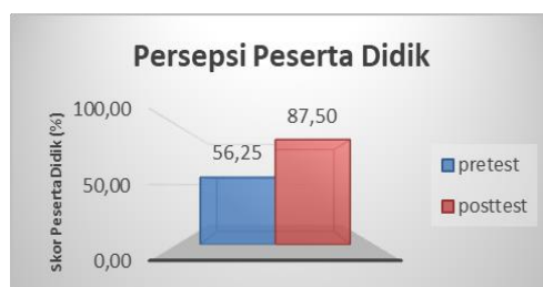
Gambar 3. Grafik persepsi peserta didik terhadap bencana

Setelah mengikuti pelatihan, skor persepsi positif peserta didik meningkat secara signifikan menjadi 88%. Hal ini menandakan bahwa kegiatan pelatihan mampu memberikan pemahaman yang lebih mendalam dan mengubah cara pandang peserta didik terhadap bencana banjir. Peserta didik menjadi lebih menyadari pentingnya kesiapsiagaan, langkah mitigasi, serta sikap yang tepat sebelum, saat, dan setelah bencana terjadi. Persepsi peserta didik terhadap bencana banjir dapat dilihat pada Gambar 3.