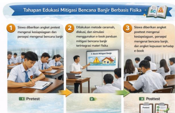
Gambar 1. Tahapan edukasi mitigasi bencana banjir

Untuk tahapan kegiatan meliputi pra kegiatan, yaitu penyusunan instrumen: koordinasi dengan sekolah, dan distribusi kuesioner pre-test , pelaksanaan: pemberian materi dengan e-book dan simulasi evakuasi banjir. Serta evaluasi: pengisian kuesioner post-test dan angket kepuasan siswa. Instrumen evaluasi berupa angket non-tes mencakup tiga aspek: (1) kesiapsiagaan, (2) persepsi, dan (3) kepuasan media. Kualitas e-book ditentukan melalui hasil analisis data dengan tahapan sebagai berikut: