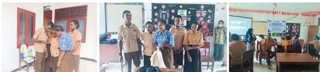
Gambar 4. Simulasi kesiapsiagaan bencana banjir

Pada saat kegiatan berlangsung, mitra berperan aktif dalam mendukung kelancaran pelaksanaan kegiatan pengabdian. Guru dan pihak sekolah turut mendampingi peserta didik selama pelatihan berlangsung, membantu mengarahkan siswa untuk berpartisipasi aktif dalam kegiatan ceramah, diskusi, serta simulasi kesiapsiagaan bencana banjir. Selain itu, guru juga membantu memotivasi siswa agar terlibat secara aktif dalam proses pembelajaran, termasuk saat mengisi angket pretest dan post-test . Dukungan dari pihak sekolah ini sangat membantu tim pengabdian dalam menciptakan suasana pembelajaran yang interaktif sehingga materi mengenai mitigasi bencana banjir dapat dipahami dengan lebih baik oleh peserta didik.