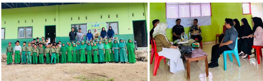
Gambar 2. Suasana pendampingan di mi alkhairaat beteleme, sulawesi tengah saat visitasi

Pada aspek pembelajaran, hasil visitasi menunjukkan kinerja yang relatif baik. Dari indikator pembelajaran yang dinilai, sekitar 70% indikator telah terpenuhi. Guru telah menciptakan suasana kelas yang aman, inklusif, dan kondusif, serta melibatkan peserta didik secara aktif melalui diskusi, kerja kelompok, dan kegiatan berbasis pengalaman belajar.