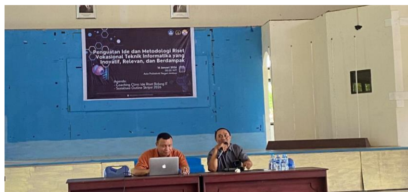
Gambar 2. Presentasi KBK Jaringan Komputer

Berikut adalah foto-foto dokumentasi kegiatan pelaksanaan Coaching Clinic skripsi. Presentasi oleh KBK jaringan komputer pada gambar 1. Anggota tim outline skripsi sebagaimana terlihat pada gambar 2.