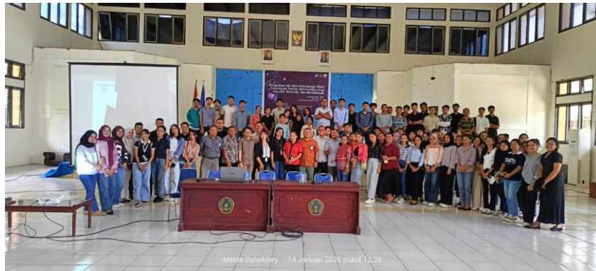
Gambar 4. Foto Bersama Tim Dosen dan Mahasiswa Peserta

Ada juga Sesi berupa workshop praktik langsung, di mana peserta mulai menyusun draft proposal masing-masing, meliputi judul penelitian, rumusan masalah, tujuan, dan metodologi eksperimen jaringan. Peserta dibimbing dalam merancang topologi jaringan, menentukan tools yang digunakan (seperti GNS3, MikroTik, atau Cisco Packet Tracer), serta menyusun skenario pengujian. Penyusunan skenario uji jaringan perlu mempertimbangkan arsitektur, protokol, keamanan, serta ukuran kinerja jaringan agar hasil eksperimen dapat dianalisis secara sistematis [14][2][21]. Yang tidak kalah penting adalah Sesi pendampingan dan review intensif, di mana tim pelaksana memberikan umpan balik langsung terhadap draft peserta. Diskusi interaktif dilakukan untuk memperbaiki struktur, kejelasan masalah, serta kesesuaian metodologi penelitian.