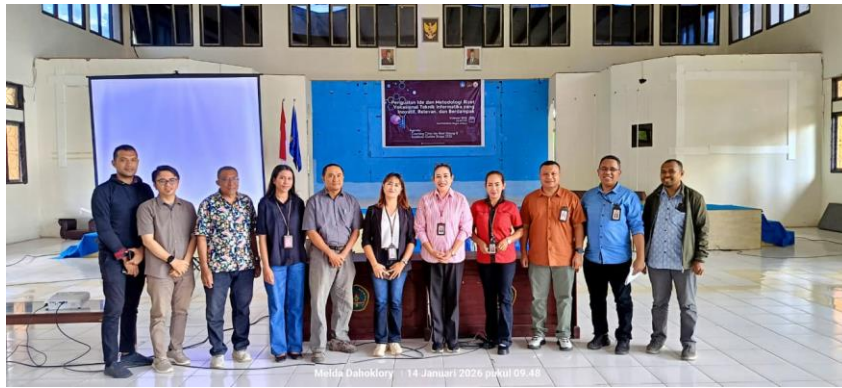
Gambar 3. Foto Bersama Tim Dosen Coaching Clinic