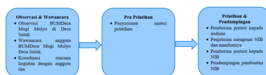
Gambar 1. Alur kegiatan pengabdian

Kegiatan ini dilakukan oleh anggota tim pengabdian dari mahasiswa dan dosen Universitas Merdeka Madiun dengan anggota BUMDesa Mugi Mulyo Desa Suluk. Kegiatan utama ini adalah pendampingan dalam pembuatan legalitas usaha berupa NIB untuk membuka akses dan peluang usaha secara legal serta mendorong pemberdayaan ekonomi masyarakat lokal. Rincian kegiatan dapat dilihat pada gambar 1.