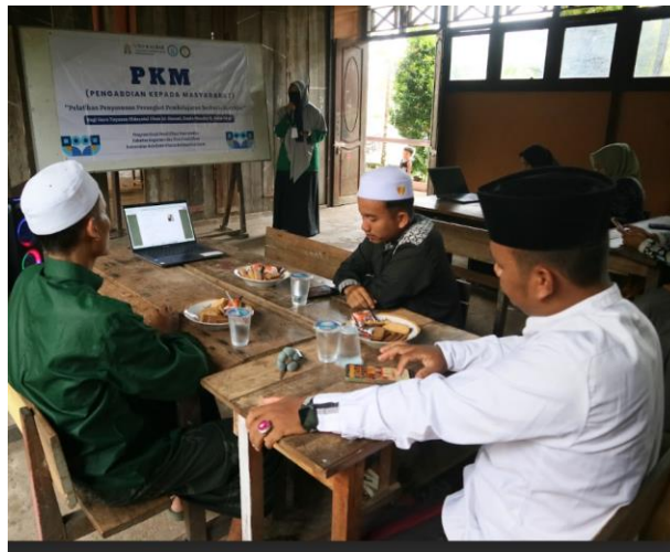
Gambar 2. Evaluasi hasil umpan balik