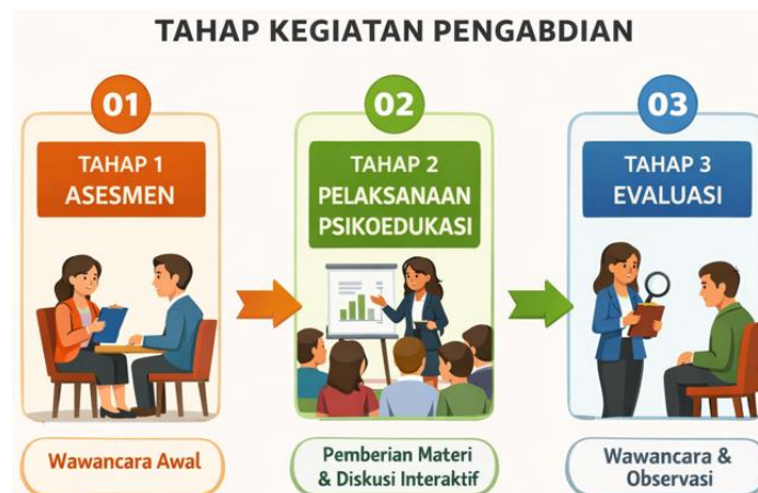
Gambar 1. Tahap pelaksanaan kegiatan