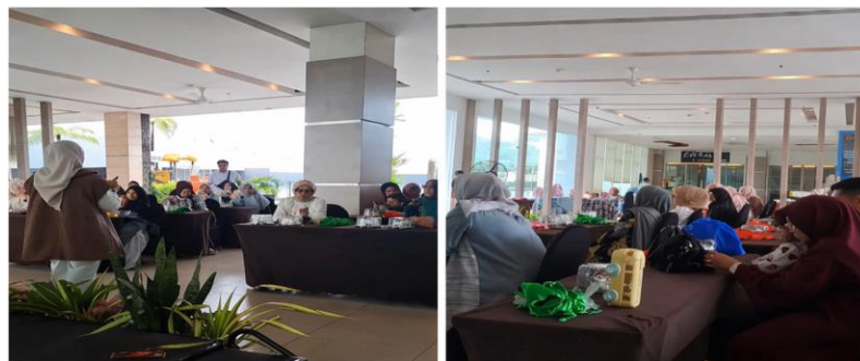
Gambar 3. Pemberian psikoedukasi dan diskusi

Hasil pelaksanaan kegiatan psikoedukasi menunjukkan adanya peningkatan pemahaman orang tua mengenai pentingnya peran keterlibatan keluarga sebagai lingkungan belajar utama bagi anak. Hal ini terlihat dari partisipasi yang cukup aktif dari peserta dalam sesi diskusi dan kemampuan mereka dalam merefleksikan pengalaman pengasuhan yang telah diterapkan di rumah. Sebagian besar peserta mulai menyadari bahwa proses belajar anak tidak hanya berlangsung di lingkungan sekolah, tetapi juga sangat dipengaruhi oleh kualitas interaksi, pola komunikasi, pemberian stimulus serta kondisi emosional dalam keluarga. Hasil ini sesuai dengan penelitian yang telah dilakukan yang menunjukkan bahwa metode psikoedukasi efektif dalam meningkatkan pemahaman, sikap dan keterampilan orang tua dalam mendampingi anak belajar [14].