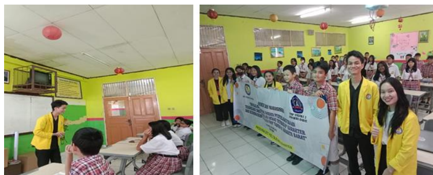
Gambar 3. Penyampaian materi oleh tim PkM di kelas B

Sama halnya dengan penyampaian materi yang dilakukan oleh Tim PkM di kelas B juga menyampaikan materi yang sama seperti tim A pada jumlah siswa sebanyak 50 orang. Penyampaian materi yang dilakukan oleh Tim PkM di kelas B juga dalam bentuk workshop. Untuk kegiatan tersebut, terlampir pada foto dibawa: