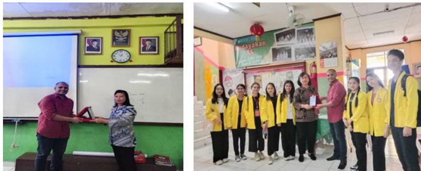
Gambar 4. Penyerahan cendramata oleh tim PkM kepada guru dan kepala sekolah