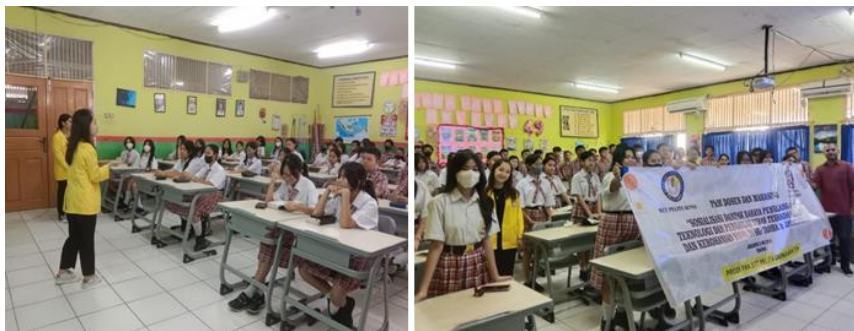
Gambar 2. Penyampaian materi oleh Tim PkM di Kelas A

Penyampaian materi di kelas A terhadap siswa 70 orang dengan topik pembahasan "Sosialisasi Dampak Penyalahgunaan Teknologi dan Pergaulan Bebas terhadap Karakter dan Kerohanian Siswa". Penyampaian materi dalam bentuk workshop yakni tim PkM menyampaikan materi dengan menggunakan media presentasi, pemutaran video singkat, serta studi kasus yang diadaptasi dari situasi nyata yang sering dihadapi remaja dalam penggunaan teknologi dan relasi sosial. Untuk kegiatan tersebut, terlampir pada foto dibawa: