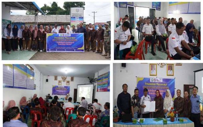
Gambar 2. Pelaksanaan Kegiatan PKM