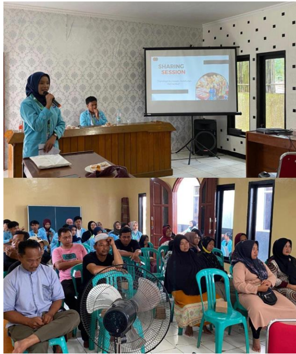
Gambar 3. Sesi Tanya Jawab

Penyampaian materi dilakukan secara interaktif agar UMKM lebih memahami pentingnya pemanfaatan teknologi digital dalam menunjang keberlanjutan usaha mereka sehingga melakukan sesi tanya jawab. Para pelaku UMKM terlihat antusias menyampaikan berbagai pertanyaan terkait pembuatan Google Maps dan aktivasi QRIS.