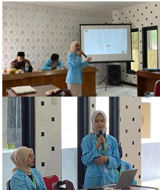
Gambar 2. Penyampaian Materi Google Maps dan QRIS

Pada tahap pelaksanaan sosialisasi yang berlangsung pada tanggal 10 Juli 2025 di aula Desa Neglasari dan dihadiri oleh kurang lebih 15 pelaku UMKM dan aparat desa. Pemateri menjelaskan pentingnya keberadaan UMKM di tengah kemajuan teknologi saat ini. Para peserta diberikan pemahaman mengenai perbedaan antara metode pembayaran tradisional dan system pembayaran QRIS, serta meningkatkan visibilitas usaha dengan menyematkan lokasi usaha pada Google Maps. Pemateri juga menguraikan konsep digitalisasi pemasaran produk, manfaat dan tujuan dari digitalisasi tersebut, serta strategi yang dapat diterapkan dalam menjalankan UMKM secara digital. Selain itu, pemateri menunjukkan secara langsung cara yang mudah dan akurat untuk melakukan transaksi menggunakan QRIS.