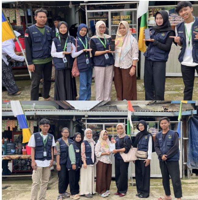
Gambar 4. Pendampingan UMKM Dalam Pembuatan Google Maps dan QRIS Secara Door to Door

Berdasarkan gambar diatas, salah satu pelaku UMKM di Desa Neglasari “Seblak Mama Bayu” di dusun 3 melakukan aktivasi QRIS dan melakukan pendaftaran usahanya di Google Maps .