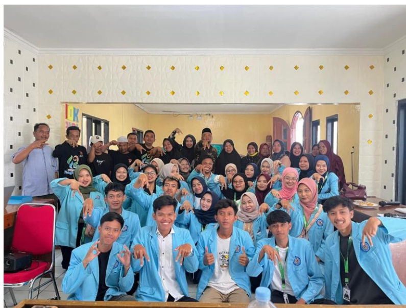
Gambar 7. Sosialisasi Digitalisasi UMKM Dihadiri Oleh Pelaku UMKM dan Aparat Desa

Gambar tersebut menggambarkan proses pendokumentasian pendaftaran lokasi usaha Usaha Mikro, Kecil, dan Menengah (UMKM) di Desa Neglasari melalui platform Google Maps, serta pembuatan QRIS sebagai sarana pembayaran digital. Kegiatan pendampingan dan sosialisasi ini bertujuan untuk mengoptimalkan pemanfaatan teknologi digital, khususnya dalam konteks pemasaran digital menggunakan Google Maps dan transaksi non-tunai melalui QRIS. Dengan langkah ini, diharapkan para pelaku UMKM di Desa Neglasari dapat mengembangkan usaha mereka secara signifikan dan menjangkau pasar yang lebih luas serta beragam.