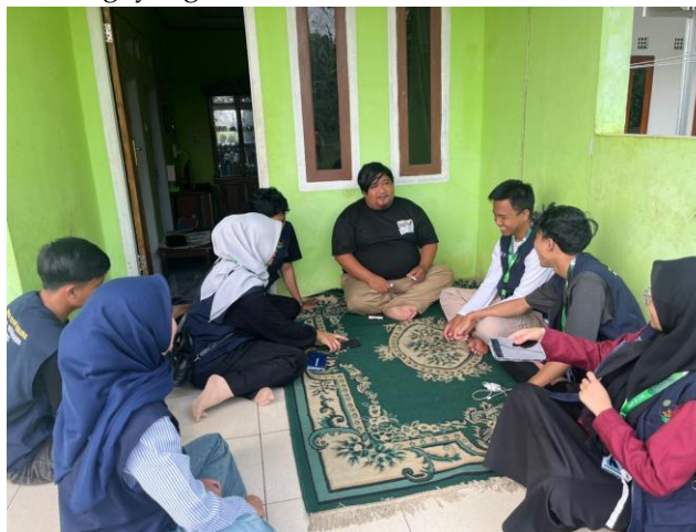
Gambar 1. Survei Lokasi UMKM

Survei dilaksanakan pada tanggal 9 Juli 2025 di Desa Neglasari dengan tujuan untuk menganalisis situasi dan kondisi yang dihadapi oleh pelaku Usaha Mikro, Kecil, dan Menengah (UMKM). Hasil dari survei tersebut menunjukkan bahwa terdapat beberapa UMKM yang tergolong cukup besar, seperti usaha kripik singkong, produksi kue basah, serta warung seblak, dan lain-lain. Meskipun demikian, proses penjualan yang dilakukan oleh para pelaku UMKM tersebut masih mengandalkan sistem manual. Hal ini disebabkan oleh kurangnya pemahaman dan keterlibatan mereka dalam mengikuti perkembangan teknologi yang ada.