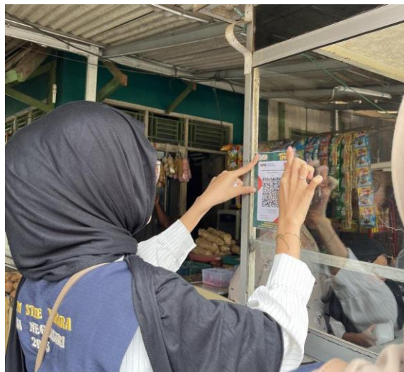
Gambar 5. Pemasangan QRIS Secara Langsung

Berdasarkan gambar diatas, salah satu pelaku UMKM di Desa Neglasari “Seblak Mama Bayu” di dusun 3 melakukan aktivasi QRIS dan melakukan pendaftaran usahanya di Google Maps .