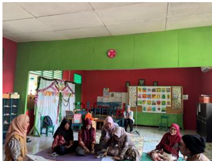
Gambar 2. Pre-test

Kegiatan dimulai dengan pre-test sederhana untuk mengetahui sejauh mana pengetahuan awal peserta tentang cara mereka mengekspresikan kasih sayang kepada anak. Hasil pre-test menunjukkan bahwa 45% orangtua belum mengetahui konsep lima bahasa cinta, dan sebagian besar menganggap bahwa memberikan hadiah atau memenuhi kebutuhan fisik sudah cukup untuk menunjukkan kasih sayang.