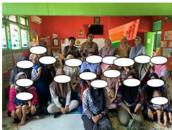
Gambar 4. Peserta Kegiatan

Para peserta terlihat sangat antusias selama kegiatan berlangsung. Hal ini terlihat dari banyaknya pertanyaan yang diajukan dan keterlibatan mereka dalam simulasi. Misalnya, ketika fasilitator meminta peserta menuliskan bentuk kasih sayang yang paling disukai anak mereka, sebagian besar mulai menyadari bahwa anak-anak menunjukkan kebutuhan afeksi yang berbeda-beda. Beberapa orangtua bahkan mengaku baru menyadari bahwa anak mereka lebih bahagia ketika diajak berbicara atau bermain bersama dibandingkan menerima hadiah.