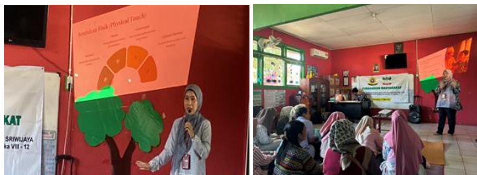
Gambar 3. Ceramah Interaktif dan sesi diskusi

Para peserta terlihat sangat antusias selama kegiatan berlangsung. Hal ini terlihat dari banyaknya pertanyaan yang diajukan dan keterlibatan mereka dalam simulasi. Misalnya, ketika fasilitator meminta peserta menuliskan bentuk kasih sayang yang paling disukai anak mereka, sebagian besar mulai menyadari bahwa anak-anak menunjukkan kebutuhan afeksi yang berbeda-beda. Beberapa orangtua bahkan mengaku baru menyadari bahwa anak mereka lebih bahagia ketika diajak berbicara atau bermain bersama dibandingkan menerima hadiah.