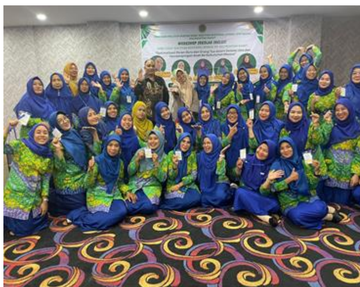
Gambar 4. Peserta Pelatihan yang berasal dari berbagai PAUD di Lingkungan Pimpinan Wilayah Aisiyyah Kalbar

Dalam implementasinya saat pelatihan, selain guru utama yang bertanggung jawab terhadap proses pembelajaran, turut hadir pula guru pendamping yang berperan memberikan dukungan individual kepada anak, baik selama kegiatan belajar maupun ketika anak membutuhkan bantuan khusus, sehingga pelaksanaan pendidikan inklusif bagi anak berkebutuhan khusus (ABK) tidak hanya berfokus pada penyediaan sarana dan prasarana yang memadai, tetapi juga pada proporsi tenaga pendidik dalam satu kelas agar proses pembelajaran dapat berjalan optimal. Pendekatan ini dimaksudkan untuk memastikan setiap anak memperoleh pendampingan yang komprehensif dan setara tanpa adanya pembedaan. Penyelenggaraan pendidikan bagi ABK harus mempertimbangkan beberapa aspek esensial, di antaranya ketersediaan sumber daya manusia yang kompeten dalam menangani beragam karakteristik perilaku anak, serta dukungan terhadap fasilitas belajar yang layak dan adaptif. Oleh karena itu, perencanaan dan penyediaan sarana-prasarana yang sesuai dengan kebutuhan peserta didik berkebutuhan khusus menjadi faktor penting dalam keberhasilan pendidikan inklusif[13]. Partisipasi mitra selama kegiatan dirasakan sangat positif dan kolaboratif. Mitra menyiapkan tempat pelaksanaan kegiatan, menunjuk guru yang berpartisipasi saat kegiatan, menyiapkan dukungan teknis serta dukungan finansial untuk menyukseskan kegiatan ini.