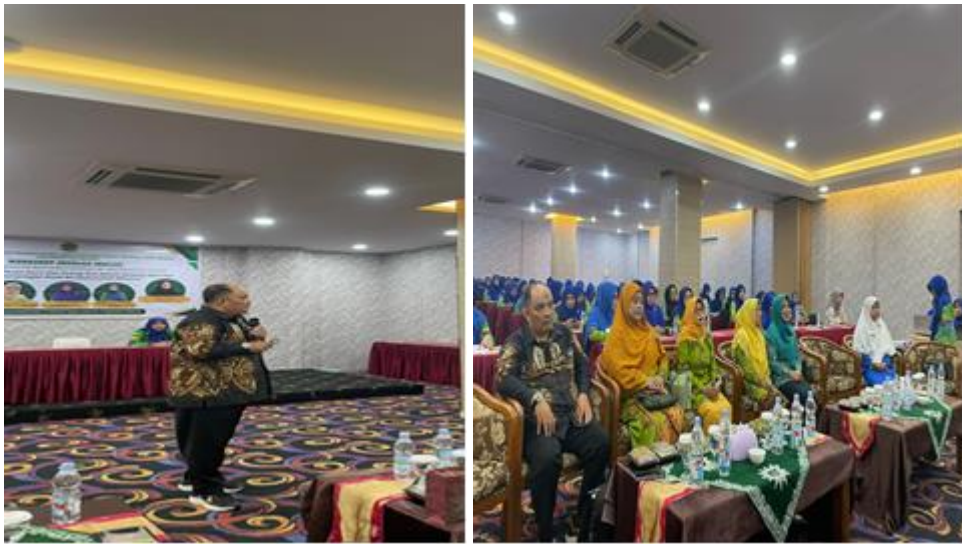
Gambar 3. Sosialisasi Mengenai Anak Berkebutuhan Khusus