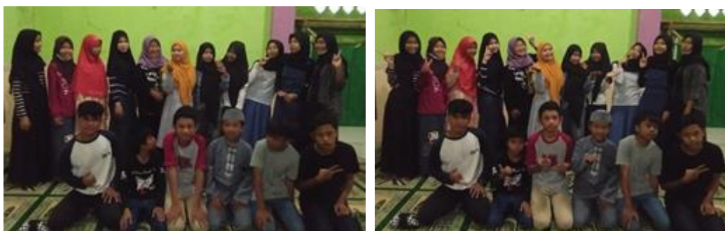
Gambar 3. Dokumentasi Foto Peserta Pelatihan Character Building , 2024

Peran mitra lokal, yaitu Ketua RW 09, pengurus RW, Karang Taruna, dan Remaja Masjid, terbukti sangat strategis dalam keberhasilan kegiatan. Mitra berperan dalam pertama, fasilitasi logistik dan tempat pelatihan, sehingga kegiatan dapat berjalan lancar. kedua, motivasi peserta, memberikan dukungan moral dan legitimasi sosial yang meningkatkan partisipasi aktif peserta. Ketiga, pendampingan pasca pelatihan, dengan mengajak peserta terlibat dalam kegiatan sosial lanjutan di lingkungan RW. Secara keseluruhan, kegiatan ini membuktikan bahwa pelatihan berbasis nilai dan pengalaman, didukung oleh kolaborasi aktif dengan mitra lokal, merupakan strategi efektif dalam membangun karakter unggul di kalangan generasi muda pedesaan. Kehadiran mitra tidak hanya memberikan legitimasi sosial, tetapi juga memperkuat motivasi peserta untuk menginternalisasikan nilai karakter dalam kehidupan sehari-hari.