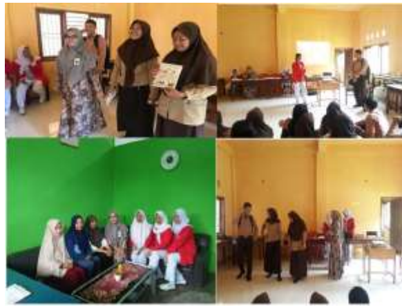
Gambar 3. Penyerahan cendra mata dari tim pengmas kepada perwakilan siswa/siswi

Pada gambar 3 merupakan sesi diskusi tanya jawab yang terlihat pada gambar siswa/siswi yang antusias mengikuti kegiatan penyuluhan ini, dan tim pengabdian masyarakat juga memeberikan bingkisan kepada setiap mahasiswa yang mampu menjawab pertanyaan terkait penyuluhan oleh pameri.seks bebas sendiri disini merupaka, Salah satu tantangan di Indonesia adalah sikap orang tua yang cenderung enggan atau merasa tabu untuk membicarakan topik seksual kepada remaja terutama pada masa awal pubertas padahal pendidikan seks memegang peranan penting sebagai upaya preventif untuk mencegah remaja dari berbagai permasalahan terkait Kesehatan reproduksi dan seksualitas [10]. Perilaku seksual bebas merupakan persoalan signifikan yang dihadapi oleh remaja di Indonesia, di mana kemudahan akses terhadap informasi yang tidak terfilter dan lemahnya pengendalian diri menyebabkan sebagian remaja cenderung mudah menerima ajakan untuk melakukan hubungan seksual pranikah dengan dalih adanya rasa saling menyukai dan mencintai, tanpa mempertimbangkan konsekuensi moral, sosial, maupun kesehatan reproduksi yang dapat ditimbulkan [11].