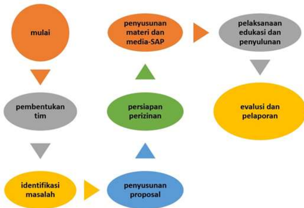
Gambar 1 : Diagram alir pengabdian masyarakat penyuluhan seks bebas

Metode yang digunakan adalah metode kegiatan penyuluhan, dengan cara menggunakan LCD dan menjelaskan power poin, setelah itu, diskusi dan tanya jawab. Untuk memotivasi siswa siswi agar penyuluhan berjalan sesuai yang diinginkan tim penyuluhan memberikan apresiasi berupa hadiah kepada siswa/siswi yang bisa menjelaskan Kembali materi penyuluhan yang sudah di sampaikan sebelumnya.