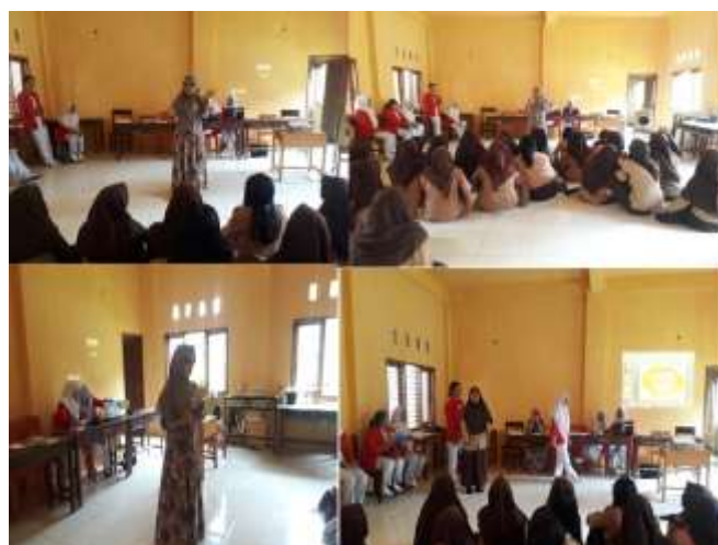
Gambar 2. Penyampaian materi seks bebas

Selanjutnya pemateri melanjutkan memberikan penyuluhan tentang dampak seks bebas pada remaja, selama proses penyampaian materi siswa/siswi mulai antusias menyimak dibuktikan sudah ada beberapa pertanyaan yang diajukan oleh siswa/siswi dan Hal yang paling menarik bagi siswa adalah tentang bahaya atau dampak seks bebas. Tiga dari lima pertanyaan yang disampaikan siswa merupakan pertanyaan terkait penyakit infeksi menular seksual. Sedangkan dua pertanyaan lagi adalah tentang dampak seks bebas terhadap kehamilan diluar nikah. Dilihat dari jenis kelamin, siswa perempuan lebih banyak bertanya tentang dampak seks bebas terhadap kehamilan di luar nikah, sedangkan siswa laki-laki lebih tertarik bertanya tentang penyakit infeksi menular seksual. Berdasarkan pada hasil evaluasi tim pengabdian kepada masyarakat terhadap siswa, terlihat bahwa penyuluhan yang diberikan dapat meningkatkan pengetahuan dan kemampuan siswa dalam memahami materi tentang seksualitas dan kesehatan reproduksi.