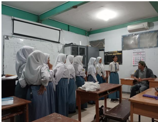
Gambar 2. Pelatihan bahasa inggris

Hal ini menciptakan motivasi masyarakat Tempat SMK Tunas Wijaya Surabaya untuk bekerja sama dengan Fakultas Hukum dalam meningkatkan mutu cara menjawab Pelatihan Berbahasa Inggris Kontekstual Persiapan kerja maupun universitas di depan Publik Berbahasa Inggris Lisan Dunia Kerja serta Universitas dengan Berbahasa Inggris secara akademis.